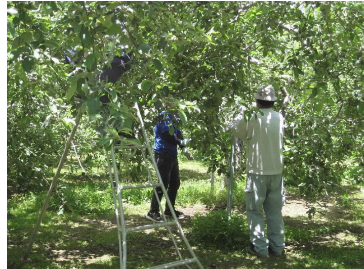
早く正確に作業を行う利用者