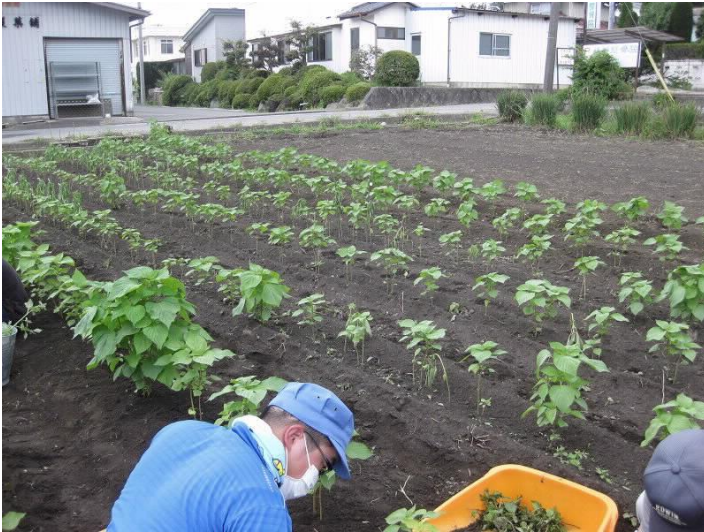
エゴマ畑の除草作業