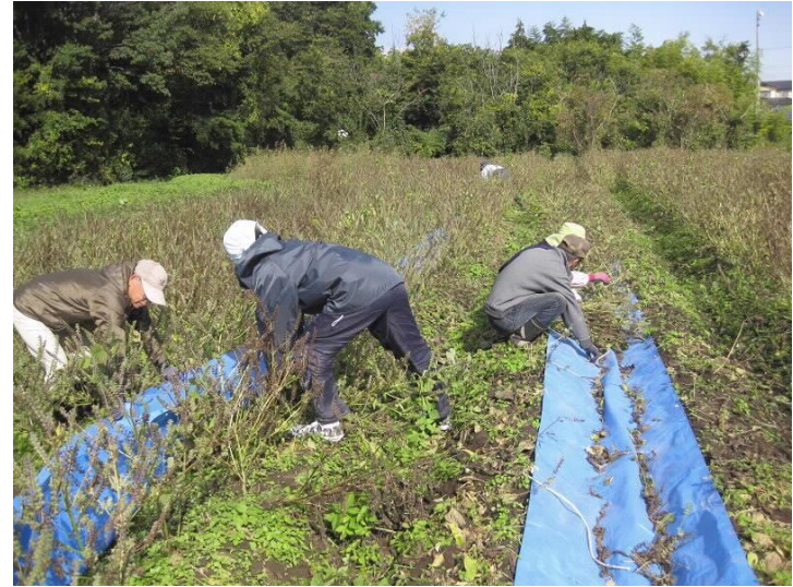
エゴマの収穫作業