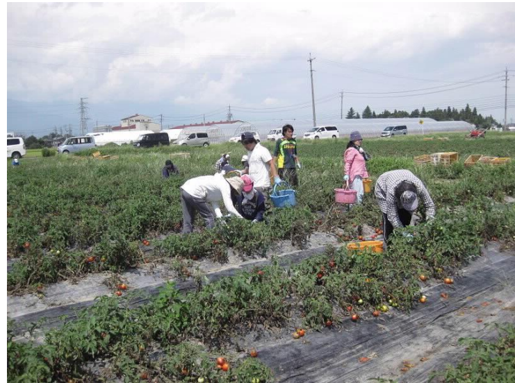
加工用トマトの収穫作業

・事業所: のむらダイム、エフォートマシュマロ、あいらいふ南原、アトリエMOO、 カフェギャラリーてくてく