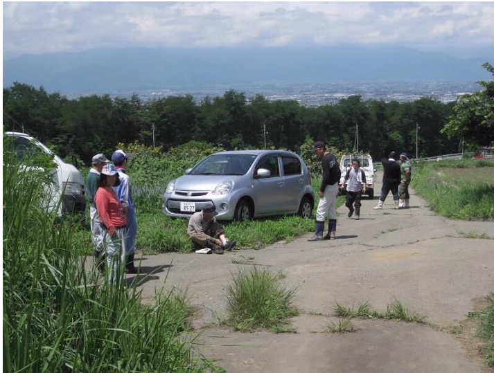
ネギ畑の除草作業