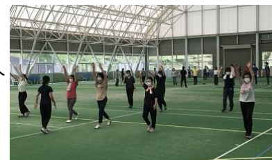
正しい歩き方講習会