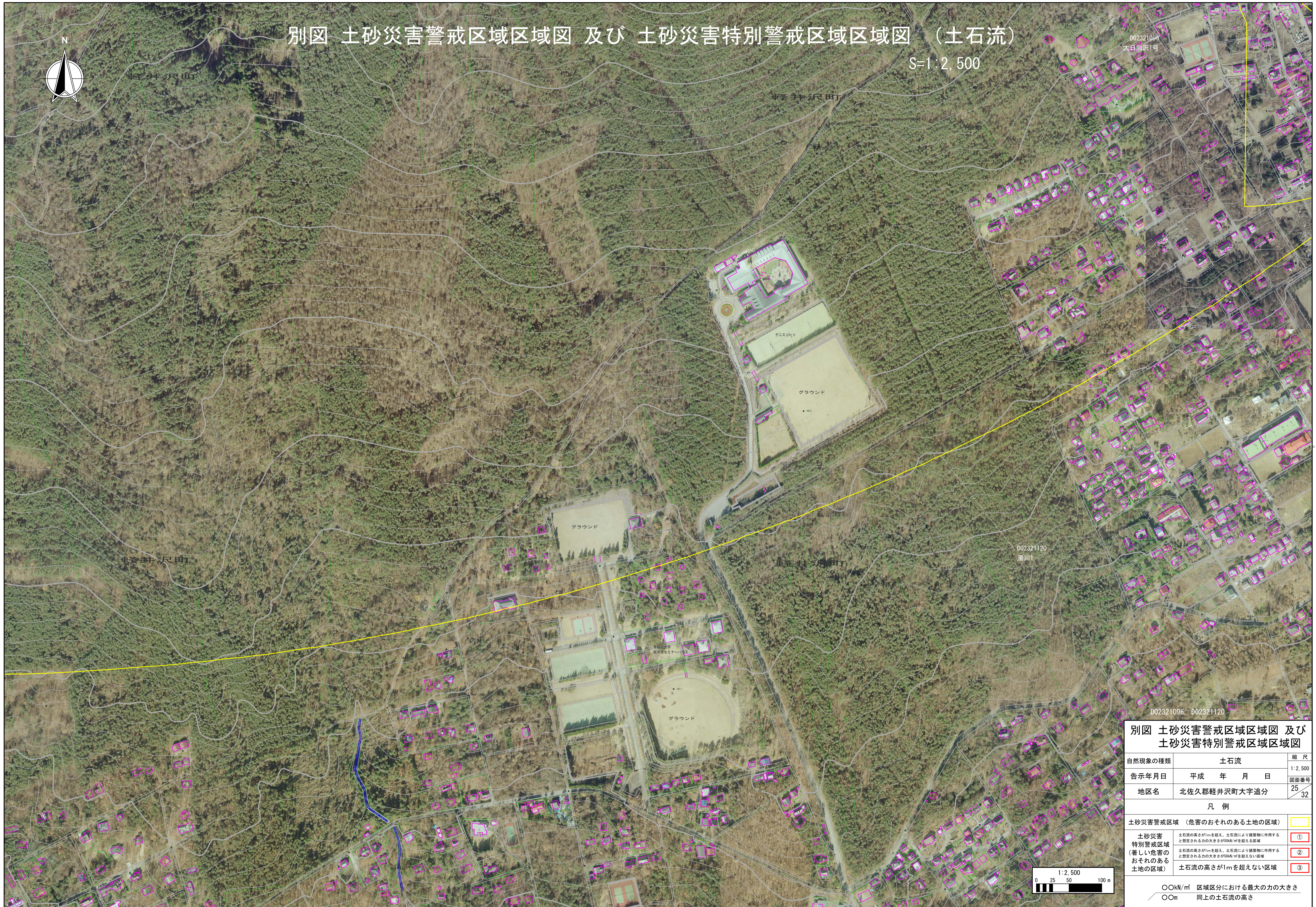
別図 土砂災害警戒区域区域図 及び 土砂災害特別警戒区域区域図