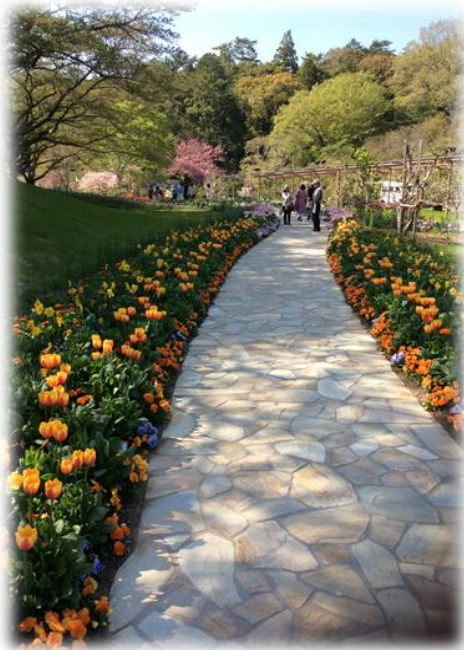
【写真】浜名湖花博 2014 第 31 回全国都市緑化しずおかフェア

全国都市緑化フェアは、国民ひとり一人が緑の大切さを認識するとともに、緑を守り、愉しめる知識を深め、緑がもたらす快適で豊かな暮らしがある街づくりを進めるための普及啓発事業として、昭和 58 年(1983 年)から毎年、全国各地で開催されている花と緑の祭典です。