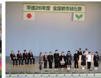
子供たちの緑化宣言