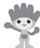
長野県ものづくり人材 育成応援キャラクター わざまる