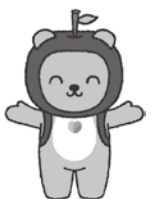
長野県PRキャラクター「アルクマ」