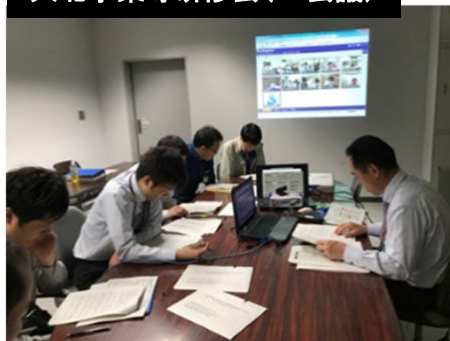
大北事案等研修会(TV会議)