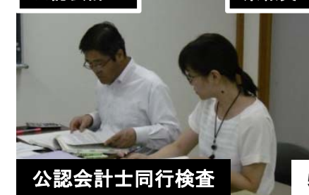
公認会計士同行検査