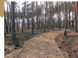
松くい虫対策の状況 林内のアカマツの枝などをチップにして、 松くい虫の被害拡大を防止します。