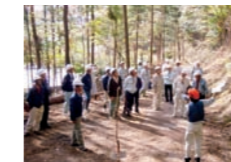
間伐モデル団地の見学会