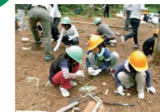
木育活動の状況 (木工クラフト体験)