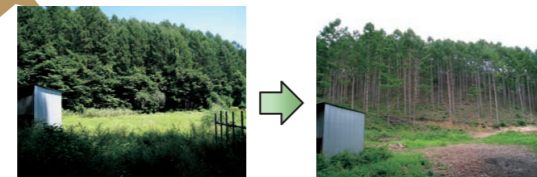
間伐実施前後の状況 林内に光が入り、明るくなりました。