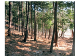
野生鳥獣対策の状況 農地等に接する林の藪を刈払い見通しを 良くして、野生鳥獣の出没を防止します。