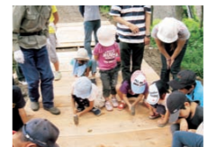
木育活動の状況 (木道スロープの組立)