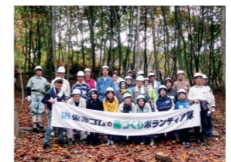
企業による森林整備