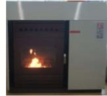
ペレットストーブには、信州型ペレットストーブ等の様々なタイプがあります。

下記の市町村に居住されている個人又は事業者の皆様で、平成23年度中（市町村が定める日）にストーブ等を設置できる方が対象となります。