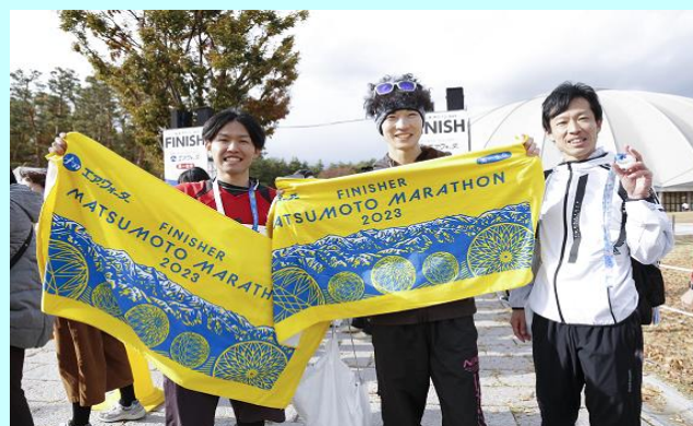
フィニッシュ会場