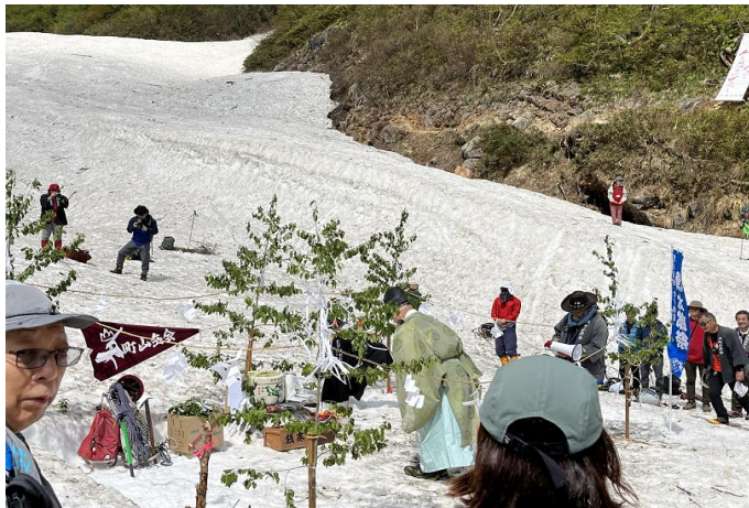
神事を行い山に感謝を

日本三大雪渓のひとつである針ノ木雪渓で、故・百瀬慎太郎をしのび、又大町の夏山開きの安全祈願の神事を行います。神事後、針ノ木峠への記念登山班と自然観察班の2コースがあり、事前にお選びいただいたコースをお楽しみいただけます。