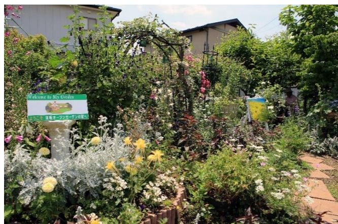
※各画像は参考画像となります