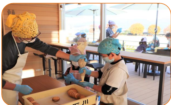
お菓子作り体験の様子

二つのアルプスを望む伊那谷には、山紫水明の当地ならではの企業や施設が数多くあります。今回は、現在世界で唯一アナログレコード量産の元となる原盤を製造しているパブリックレコードや、当地の代表的企業のひとつである伊那食品工業では栄養ケアのプロフェッショナルからのアドバイス、菓子庵石川ではお菓子作り体験など実際の現場での見学・体験を通して学びを深めることができます。また、令和5年の大規模改修により地域に開かれた西天竜発電所も見学します。小学生の時に味わった社会科見学のワクワク感をもう一度感じながら、“これからの生き方の新しい視点/スキル向上”に繋げましょう。