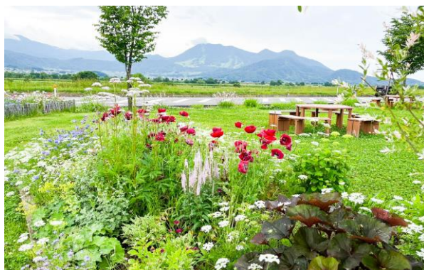
※各画像は参考画像となります