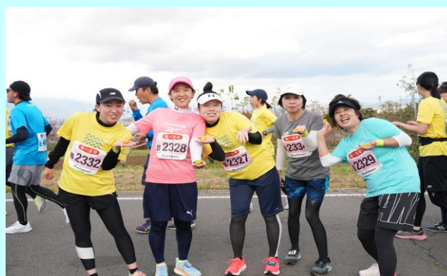
峠の茶屋 笑顔のランナーの皆さん