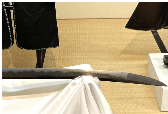
展示日本刀例 銘「長義」