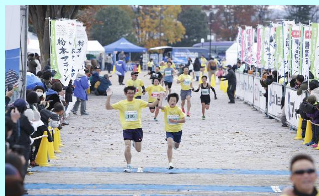
ファミリーラン ゴールの様子