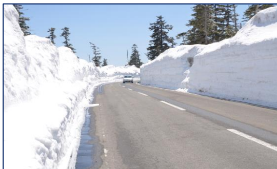
※各画像は参考画像となります