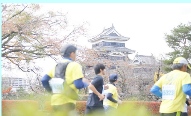
松本城をバックに!