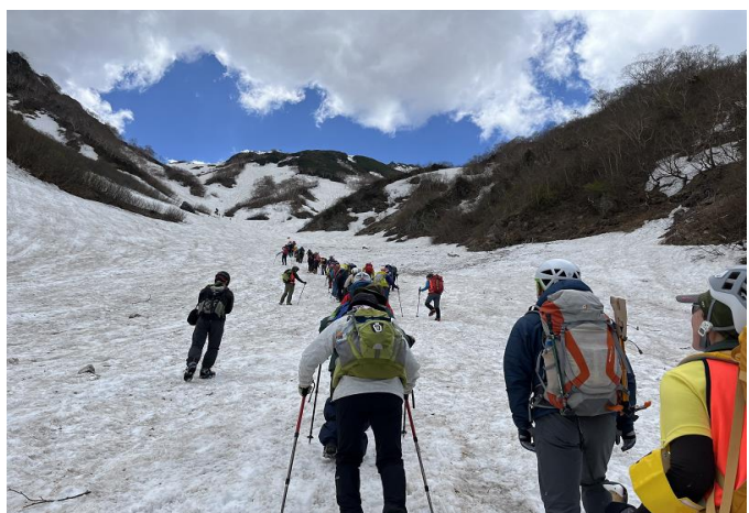
いよいよ大雪渓へ