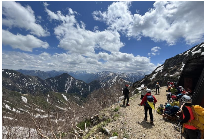
がんばったご褒美の絶景です