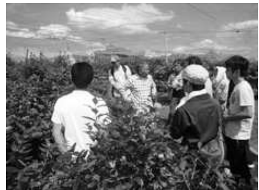
【就農体験研修の実施】 （1ターン就農者のほ場見学と体験談）