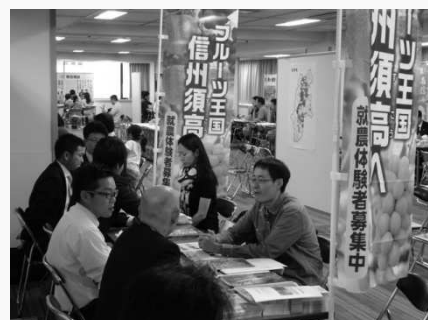
【市町村・JAが参加した相談会】