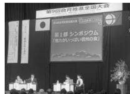
【第9回食育推進全国大会】