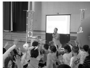
(匂ちゃん学校訪問の様子)