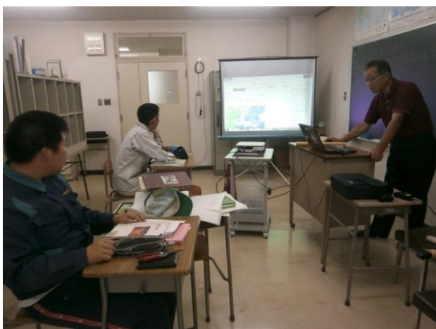
農業気象学(天気図解析)