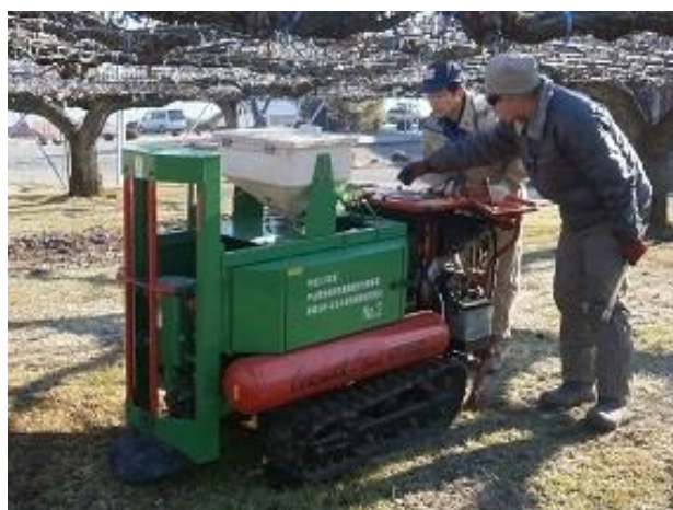
土壌肥料学(土壌改良実習)