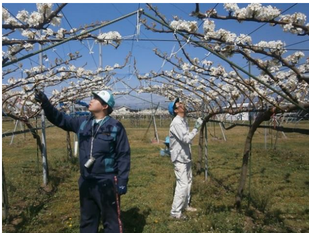
果樹園芸学(なしの人工受粉)