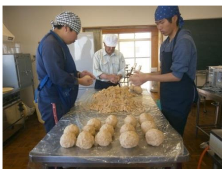
農産加工(手造り味噌)