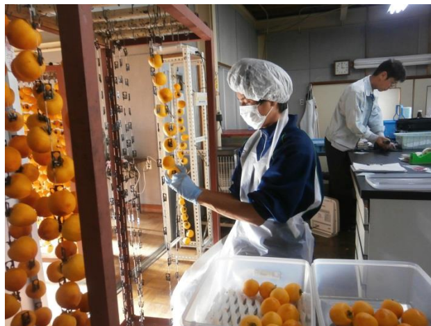
果樹園芸学(かきの連づくり)