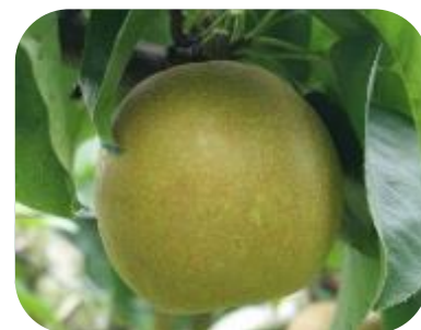
南信農業試験場が育成し、平成24年3月に品種登録された、黒星病に強い早生の甘い日本なしサザンスイート