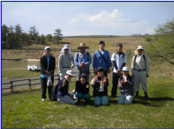
高ボッチ高原演習