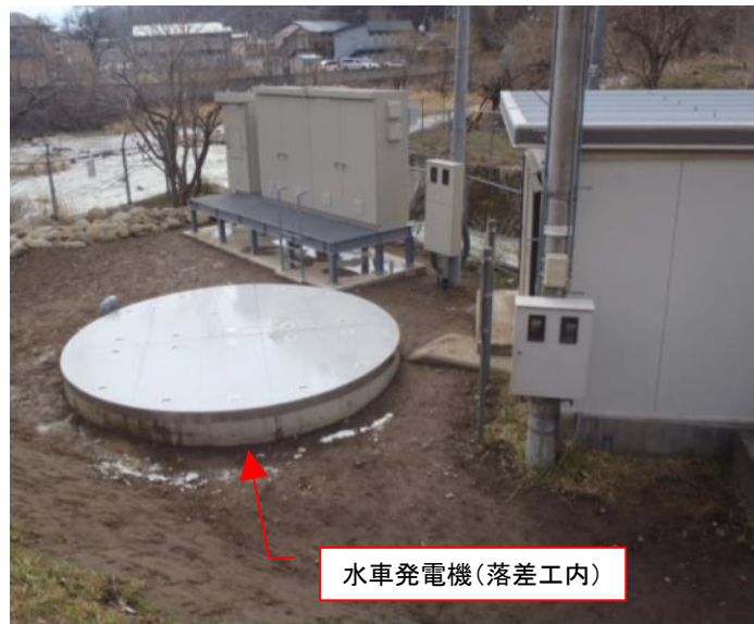
水車発電機(落差工内)