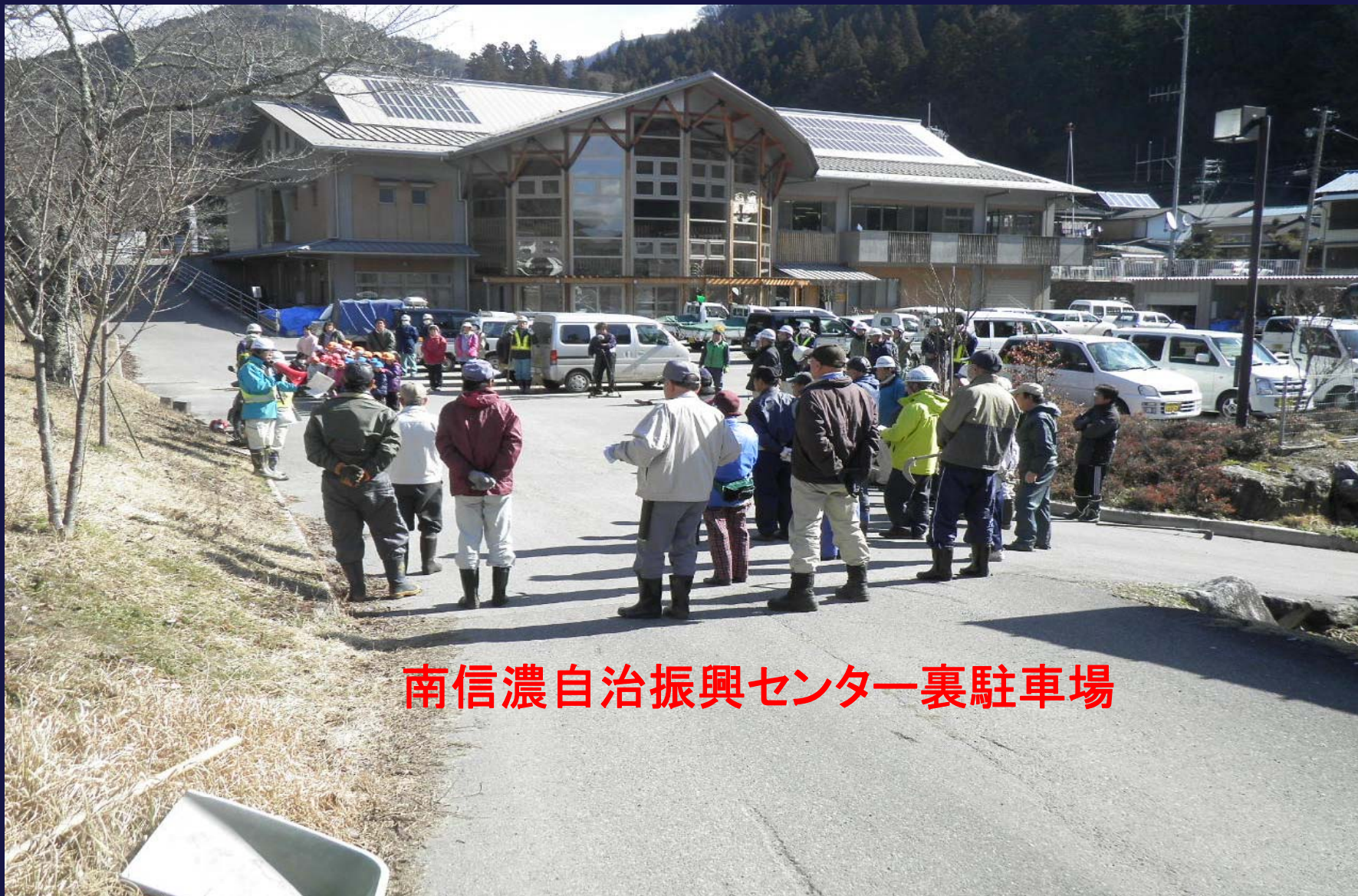
南信濃自治振興センター裏駐車場