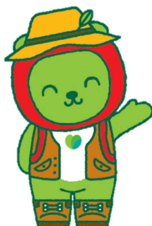
長野県PRキャラクター「アルクマ」 (信州DCバージョン) ©長野県アルクマ

http://www.pref.nagano.lg.jp/haikibut/kurashi/recycling/shigen/kenminundo/index.html