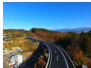
完成した豊野ライン