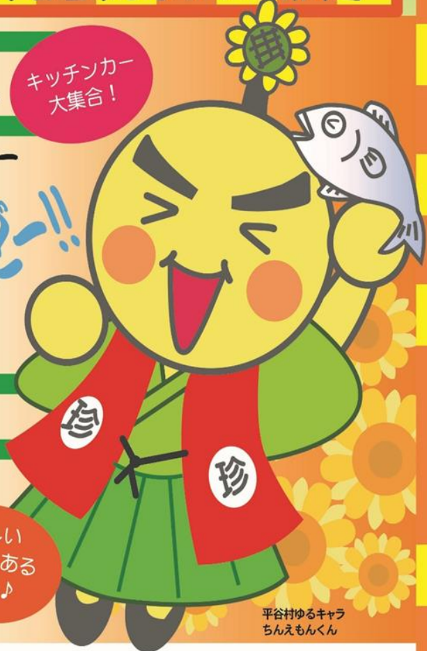
平谷村ゆるキャラ ちんえもんくん