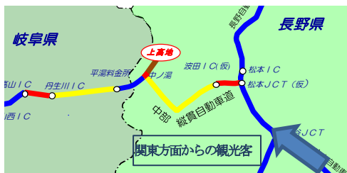
東京からの所要時間

中部縦貫自動車道が整備されると、東京からの所要時間は約40分も短縮されると、更に多くの観光客が期待できます。