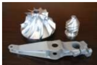
航空機部品(コックピット部品等)