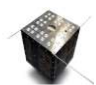
実験衛星ぎんれいの部品も製作