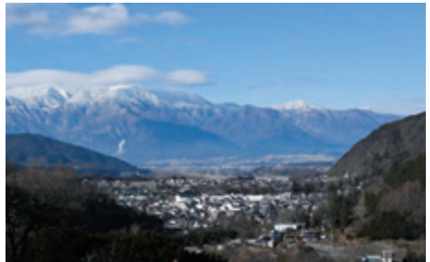
高遠町から望む中央アルプス

また、県の北部では1mを超える降雪地帯で、特に新潟県や富山県との県境地域では、3mを超える世界的にも有数の豪雪地帯です。