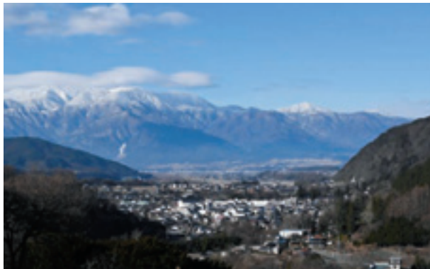
高遠町から望む中央アルプス

また、県の北部では1mを超える降雪地帯で、特に新潟県や富山県との県境地域では、3mを超える世界的にも有数の豪雪地帯です。