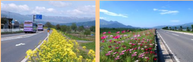
フラワーロード（国道 117 号）