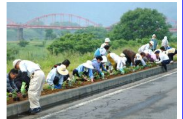
市民参加による花の植栽（フラワーロード）