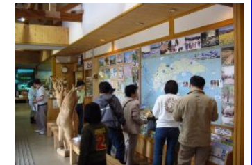
北信州の情報発信の拠点（道の駅）

信州菜の花地域ウェルカムプラン策定調査委員会 「花の駅 千曲川」「ふるさと豊田」「信越 さかえ」 地元企業・組合