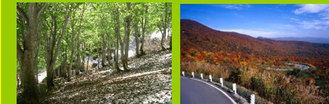
散策道（ロングトレイル）