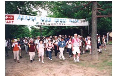
アサマスタークロスウォーク