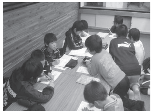
放課後子ども教室