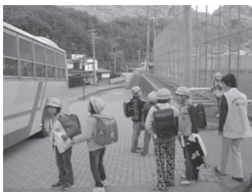
スクールバスの見守り