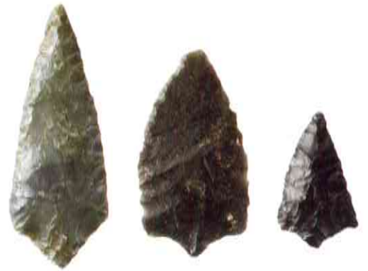
《有舌尖頭器》柳又遺跡出土 旧石器時代末～縄文時代草創期 木曾町教育委員会蔵