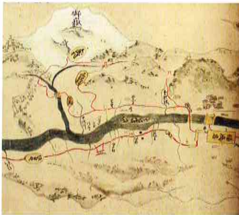
《木曾谷中山川之図》 江戸時代 個人蔵・木曾福島郷土館寄託(会期中場面替え)