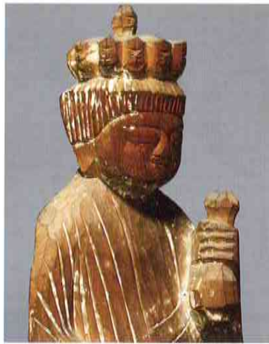
円空《十一面観音坐像》江戸時代 橋守神社蔵

本展では、木曾地域に伝わる、旧石器時代から現代に至る文化財や美術工芸品100件余りを一堂に展示します。美しい自然のもとに現在も引き継がれる第一級の資料をご覧ください、木曾の文化に触れてください。