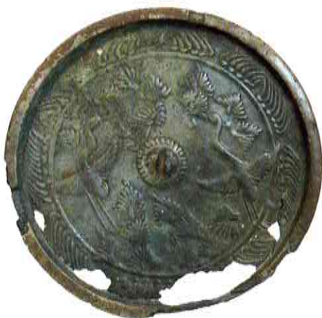
《松喰鏡》平安時代末～鎌倉時代初期 王滝村・御嶽神社蔵