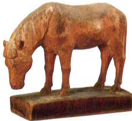
千村士乃武《木曾馬》 昭和時代 上松町教育委員会蔵・木曾路美術館寄託