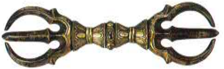
《三結杵》南北朝時代～室町時代初期 出雲神社蔵