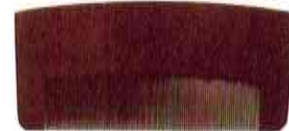
川口助一《お六柳》 昭和時代 木祖村教育委員会蔵