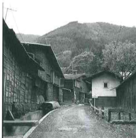
澤田正春《無題(奈良井宿)》昭和時代 王滝村蔵