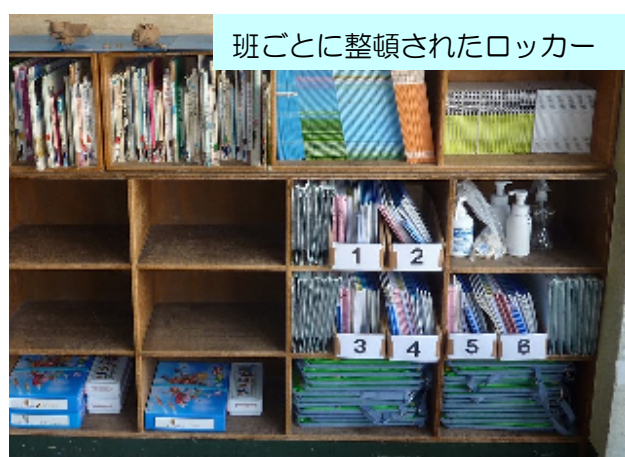
班ごとに整頓されたロッカー