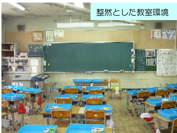
整然とした教室環境

K小学校では、子どもたち全員が、日々の授業で学習の楽しさや学ぶことの喜びを感じることが、予防的生徒指導につながると考え、「授業のユニバーサルデザイン化」を大事にしています。