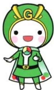
おたすけグリーン

「長野養護学校」では、食育月間に合わせて「給食旬間」をしていたわ。給食コーナーには身じたくチェックなどの給食の心がまえやおいしい給食を作ってくれる調理員さんの紹介が行われているわね。