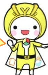
ほかほかイエロー

今回、ほんの一部を紹介したけど、このほかにも県下各地の学校で紹介しきれないくらいたくさんの方の取り組みをしてくれたんだよ！ 毎日、当たり前のように食事をしているけど、食べることはとっても大切なことだよ。そのことに少しでも気づくきっかけになるとうれしいな。