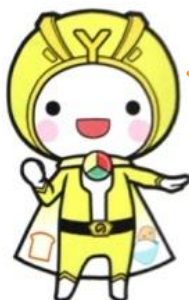
ほかほかイエロー

これは伊那市にある「西箕輪中学校」の様子。 朝ごはんの大切さを真剣に聞いているね。 みんな受験勉強に向けてしっかり朝ごはんを食べようね。