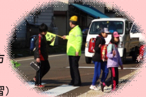
登下校のふれあい (見守り隊)