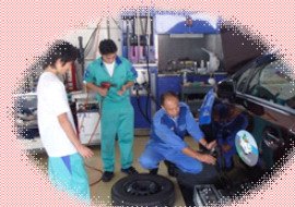
社会や生き方を学ぶ (職場体験学習)