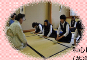
和心にふれる (茶道クラブ)