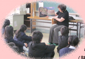
心の栄養 (読み聞かせ)