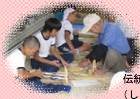
伝統を引き継ぐ (しめ縄づくり)