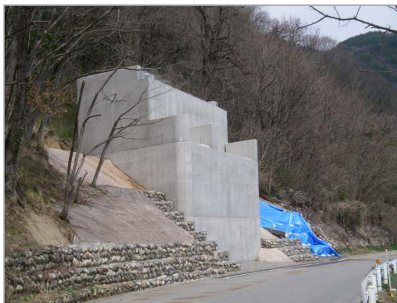
① 山清路防災 橋梁下部施工状況