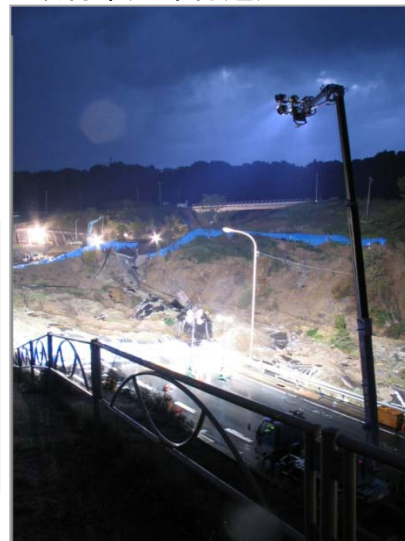
③ 平成16年9月 台風22号による災害(道路崩壊)(長野市信更町安庭)