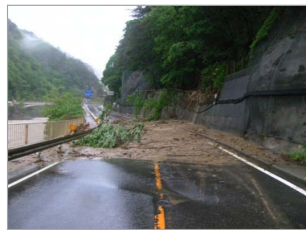
② 平成23年5月 台風2号による災害(土砂崩れ) (生坂村東広津付近)