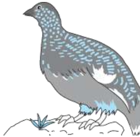
นกที่เป็นสัญลักษณ์ของจังหวัดนากาโนะ [นกไรโจ]

ผลไม้ที่ขึ้นชื่อของจังหวัดได้แก่ แอปเปิ้ล นอกจากนี้ยังผลิตองุ่นเคียวโฮ, ลูกพรุน, แอปริคอต, บลูเบอร์รี่และอื่นๆได้เป็นจำนวนมากอีกด้วย สำหรับผักที่ผลิตได้มากเป็นพิเศษในจังหวัดนากาโนะ ได้แก่ ผักกาดหอม, เซโรลี, แอสพาราแกส, วาซาบิ เป็นต้น