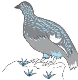
Ave símbolo da província: galvo silvestre [Raicho]

A maçã é uma fruta famosa da província. Também é grande a produção de uvas Kyoho , ameixas, damasco, blueberry, etc. Dentre as verduras, a produção de alface, salsa, aspargo, wasabi (raiz forte japonesa), etc., são particularmente grandes.