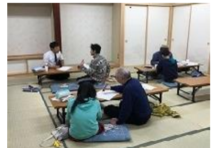
学習支援の様子(伊那市)