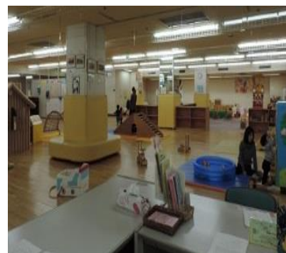
子育て支援拠点(こども広場)

病児・病後児保育実施市町村数 H26年度：17市町村 24か所 ⇒ H27年度：20市町村 28か所