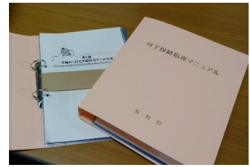
母子保健マニュアル

産後うつ病スクリーニング実施市町村数（実績） H26年度 48市町村 ⇒ H27年度 55市町村