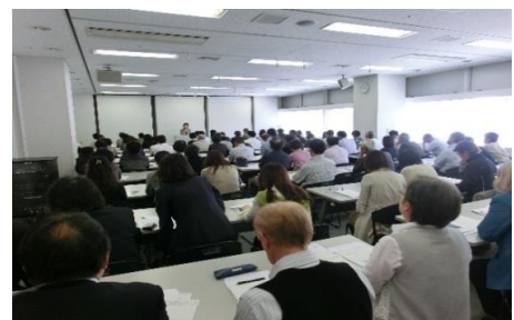
サポーター講習会の様子