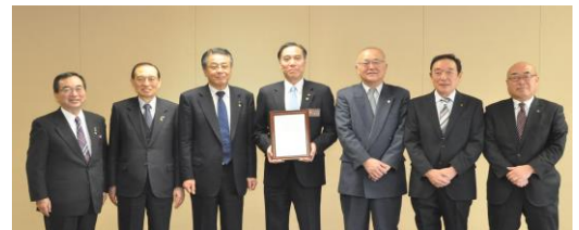
「共同宣言」を手に委員全員で決意表明