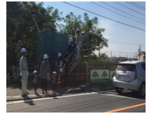
職域拡大イベント (橋梁工事現場見学会)