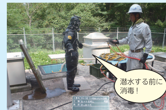
潜水する前に消毒!

水道水の供給を止めないように、配水池等に潜水して清掃し、安全・安心な水道水をお届けします。