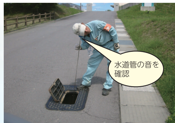
水道管の音を確認

漏水率(配水量に対する漏水量の割合)は、平成19年度の15.7%から平成25年度は10.3%と、年々改善傾向にあります。