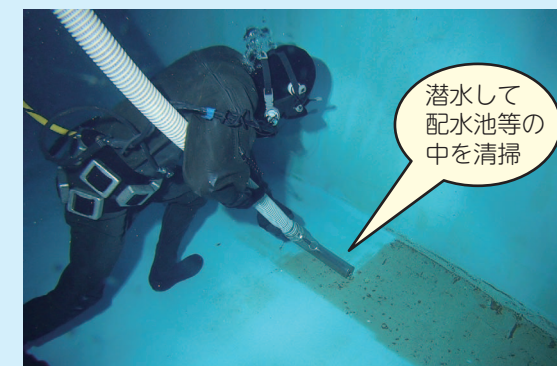
潜水して配水池等の中を清掃