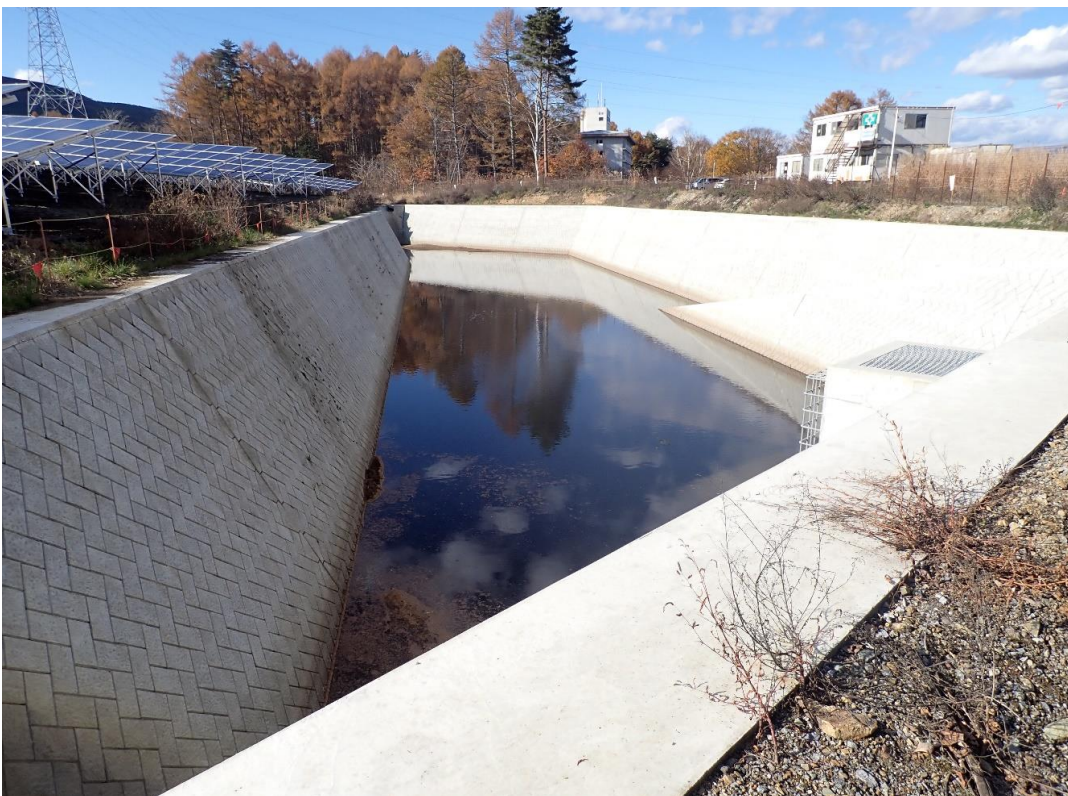
② 森林地域の縮小区域(太陽光発電施設・防災施設)