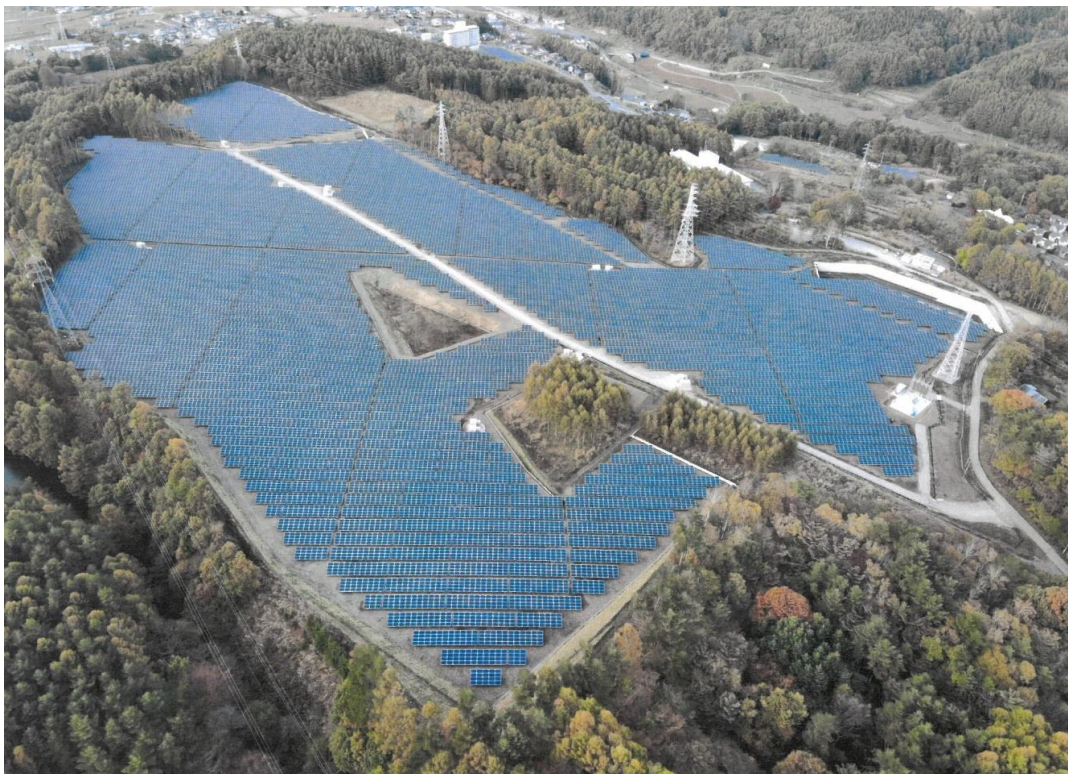
① 森林地域の縮小区域(太陽光発電施設)