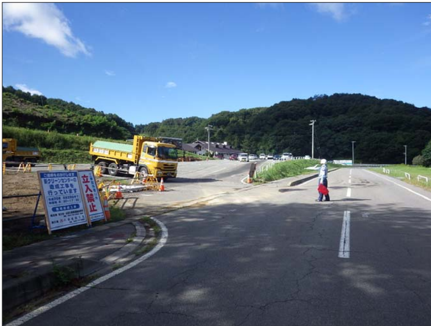
写真区分: 施工状況写真 工種: 安全費 種別: 交通誘導員 写真タイトル: 配置状況 撮影箇所: 現場出入口