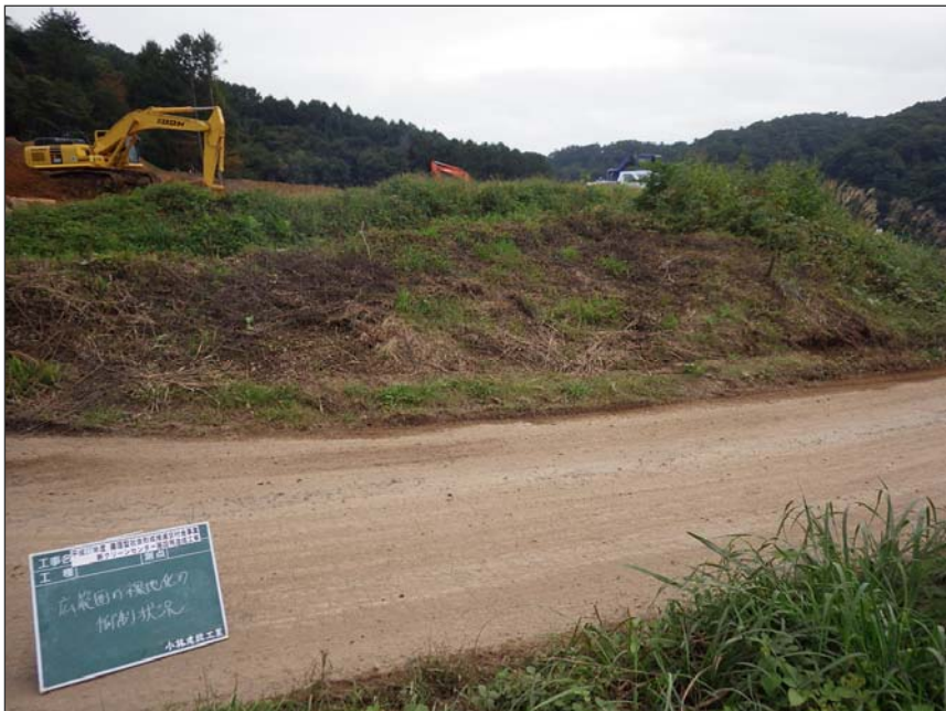
写真区分: 環境対策 工種: 広範囲裸地化の抑制状況 写真タイトル: 現場状況写真 撮影箇所: 現場にて