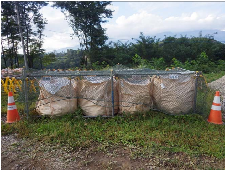
写真区分:環境対策 工種:現場でのゴミの分別 写真タイトル:分別状況写真 撮影箇所:現場事務所外部