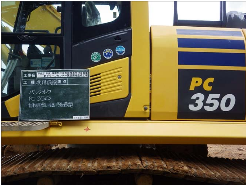
写真区分:使用機械写真 工種:バックホウ 種別:PC350 写真タイトル:使用機械(排 対型・低騒音型) 撮影箇所:現場にて