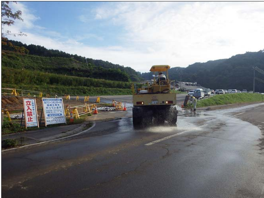
写真区分:環境対策 工種:工事用車両出入口の路面洗淨 写真タイトル:散水状況写真 撮影箇所:工事車両出入口