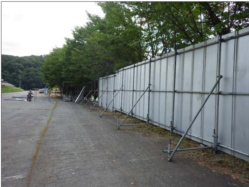
写真区分: 施工状況写真 工種: 仮設工 種別: 仮囲い設置工 細別: 施工状況 写真タイトル: 鋼板設置状況 撮影箇所: 補強土壁前県道側