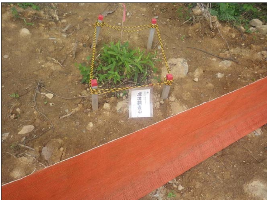
写真区分: 施工状況写真 工種: 仮設工 種別: 仮囲い設置工 写真タイトル: メッシュネット設置状況 撮影箇所: 環境保全植物周辺