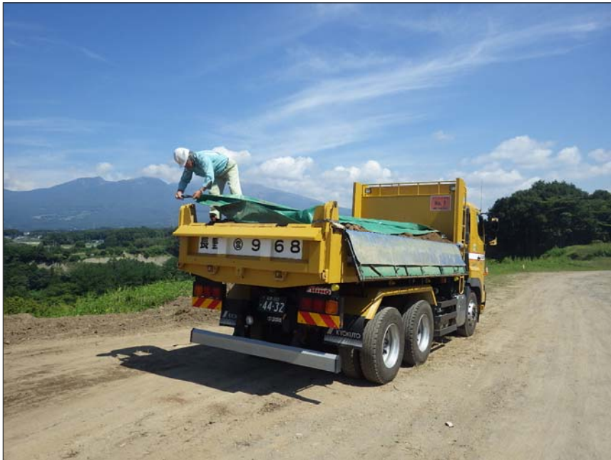
写真区分:環境対策 工種:土砂搬出車両荷台保護 種別:シート養生 写真タイトル:シート設置状況 撮影箇所:現場にて