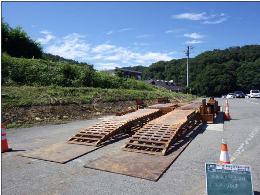
写真区分: 施工状況写真 工種: 仮設工 種別: 泥落装置設置工 細別: 設置 写真タイトル: 設置状況 撮影箇所: 現場にて