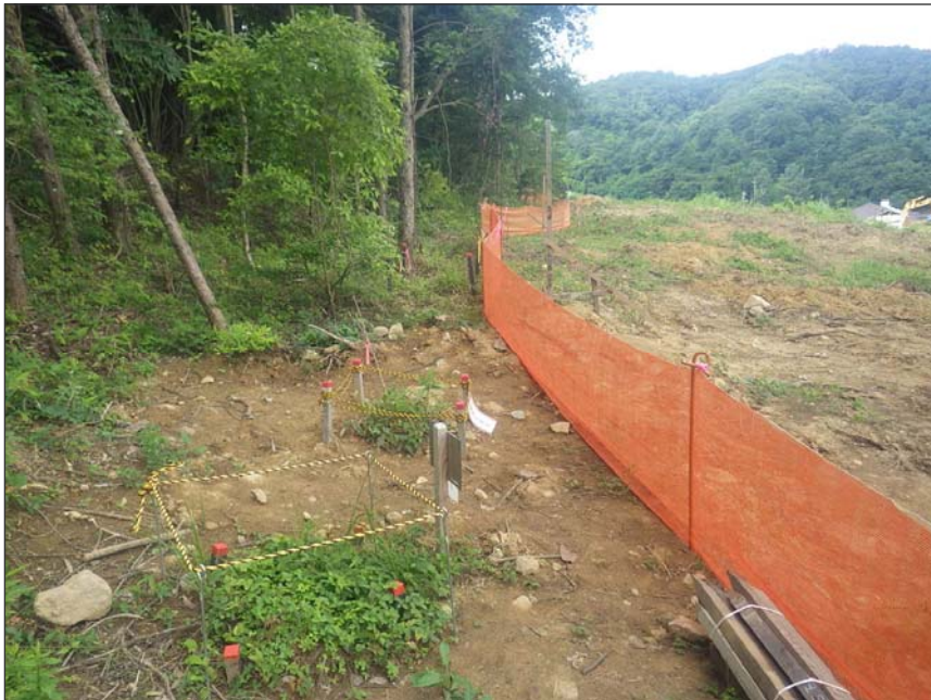
写真区分: 施工状況写真 工種: 仮設工 種別: 仮囲い設置工 写真タイトル: メッシュネット設置状況 撮影箇所: 環境保全植物周辺