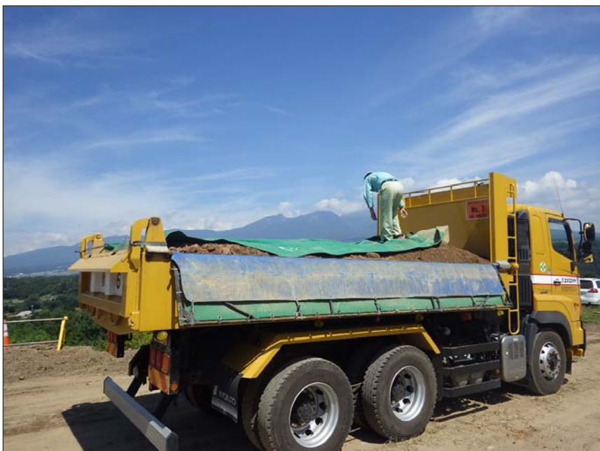
写真区分:環境対策 工種:土砂搬出車両荷台保護 種別:シート養生 写真タイトル:シート設置状況 撮影箇所:現場にて