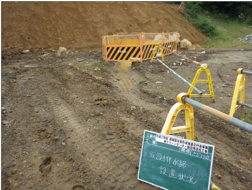
写真区分:環境対策 工種:沈砂池等の設置 写真タイトル:仮排水路設置 状況写真 撮影箇所:現場にて