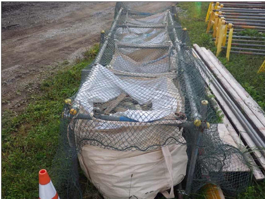
写真区分:環境対策 工種:現場でのゴミの分別 写真タイトル:分別状況写真 撮影箇所:現場事務所外部