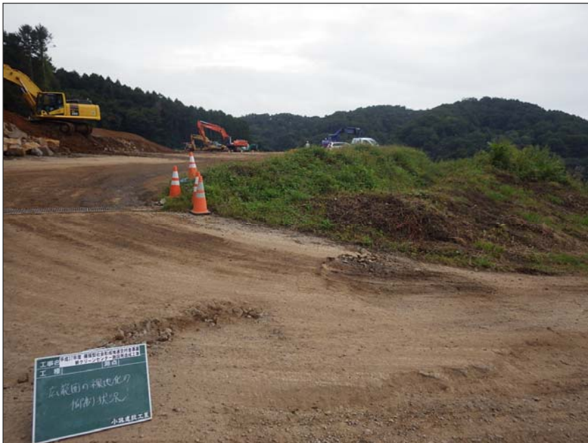
写真区分: 環境対策 工種: 広範囲裸地化の抑制状況 写真タイトル: 現場状況写真 撮影箇所: 現場にて