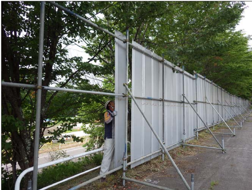
写真区分: 施工状況写真 工種: 仮設工 種別: 仮囲い設置工 細別: 施工状況 写真タイトル: 鋼板設置状況 撮影箇所: 補強土壁前県道側