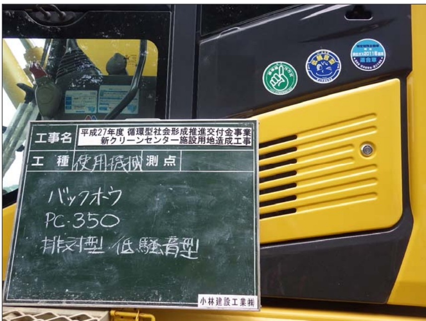
写真区分:使用機械写真 工種:バックホウ 種別:PC350 写真タイトル:使用機械(排 対型・低騒音型) 撮影箇所:現場にて