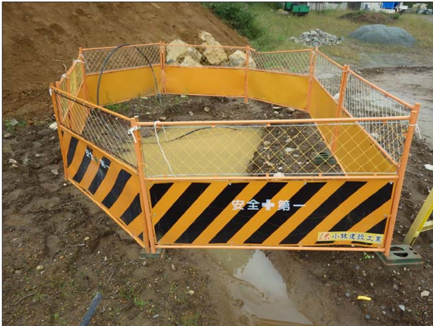
写真区分:環境対策 工種:沈砂池等の設置 写真タイトル:仮排水路設置 状況写真 撮影箇所:現場にて