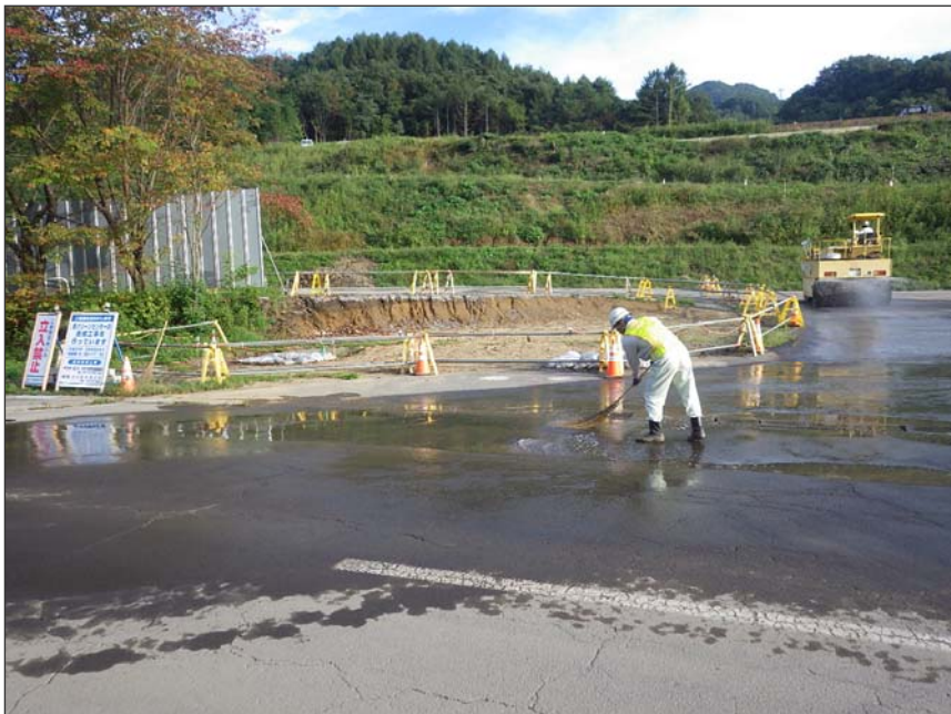
写真区分:環境対策 工種:工事用車両出入口の路面洗淨 写真タイトル:散水状況写真 撮影箇所:工事車両出入口