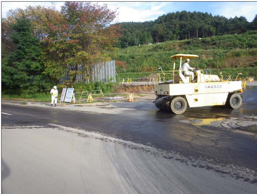
写真区分:環境対策 工種:工事用車両出入口の路面洗淨 写真タイトル:散水状況写真 撮影箇所:工事車両出入口