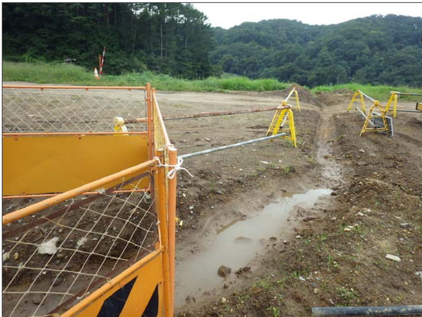
写真区分:環境対策 工種:沈砂池等の設置 写真タイトル:仮排水路設置 状況写真 撮影箇所:現場にて