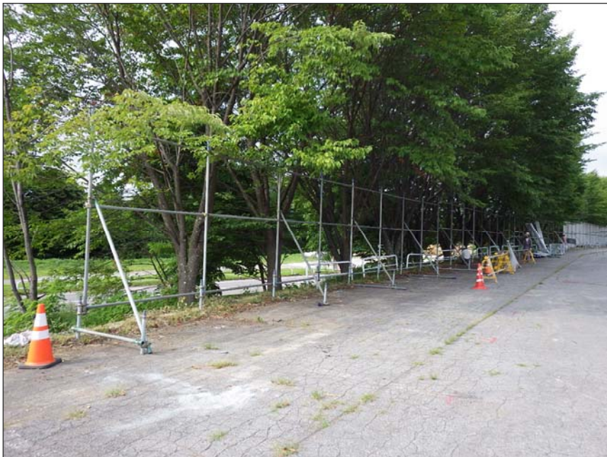
写真区分: 施工状況写真 工種: 仮設工 種別: 仮囲い設置工 細別: 施工状況 写真タイトル: 単管組立状況 撮影箇所: 補強土壁前県道側