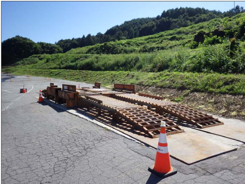
写真区分: 施工状況写真 工種: 仮設工 種別: 泥落装置設置工 細別: 設置 写真タイトル: 設置状況 撮影箇所: 現場にて