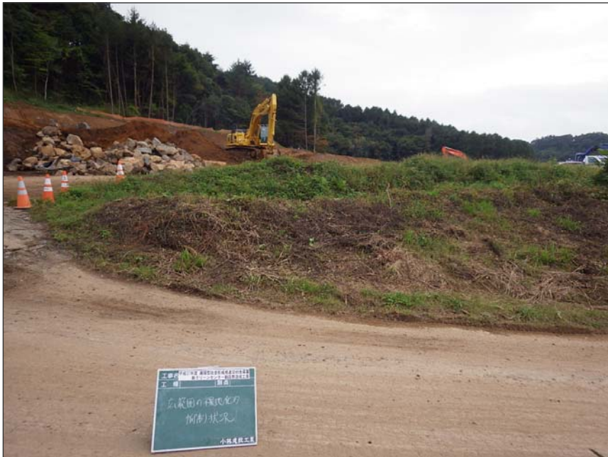
写真区分: 環境対策 工種: 広範囲裸地化の抑制状況 写真タイトル: 現場状況写真 撮影箇所: 現場にて