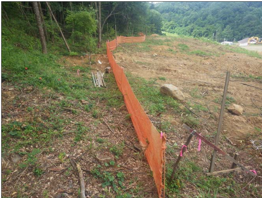
写真区分: 施工状況写真 工種: 仮設工 種別: 仮囲い設置工 写真タイトル: メッシュネット設置状況 撮影箇所: 環境保全植物周辺