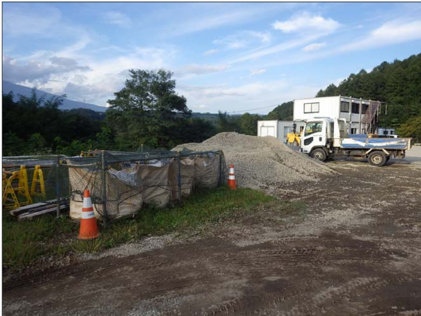
写真区分:環境対策 工種:現場でのゴミの分別 写真タイトル:分別状況写真 撮影箇所:現場事務所外部