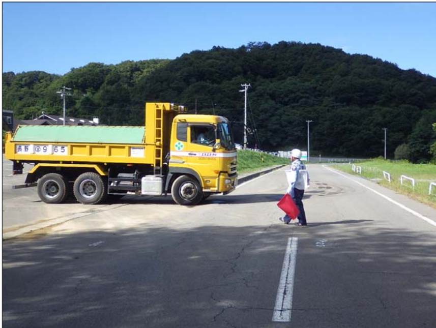
写真区分: 施工状況写真 工種: 安全費 種別: 交通誘導員 写真タイトル: 配置状況 撮影箇所: 現場出入口