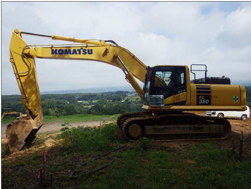
写真区分:使用機械写真 工種:バックホウ 種別:PC350 写真タイトル:使用機械(排 対型・低騒音型) 撮影箇所:現場にて