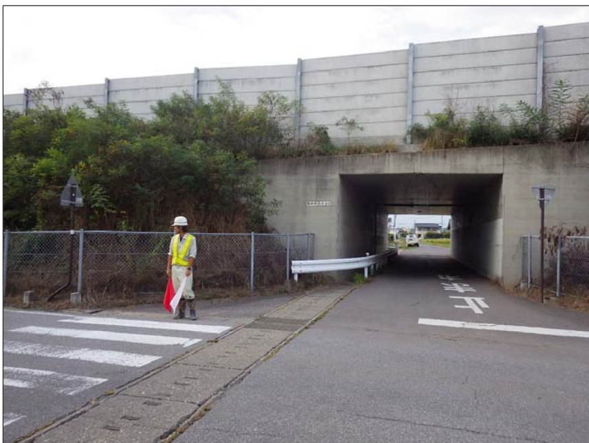
写真区分: 施工状況写真 工種: 安全費 種別: 交通誘導員 写真タイトル: 配置状況 撮影箇所: 通学路横断歩道