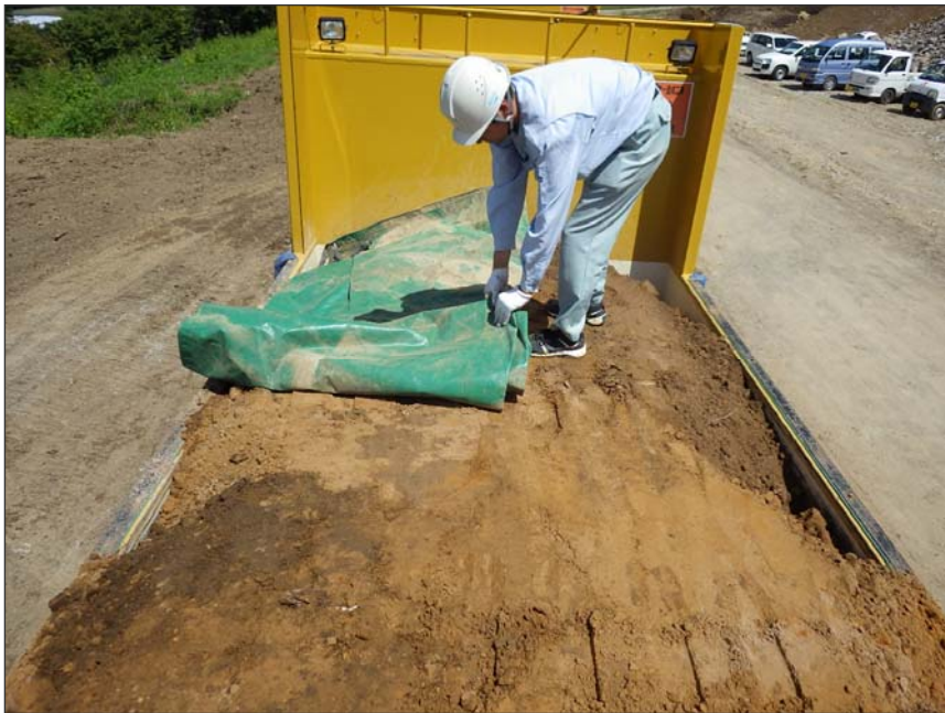
写真区分:環境対策 工種:土砂搬出車両荷台保護 種別:シート養生 写真タイトル:シート設置状況 撮影箇所:現場にて