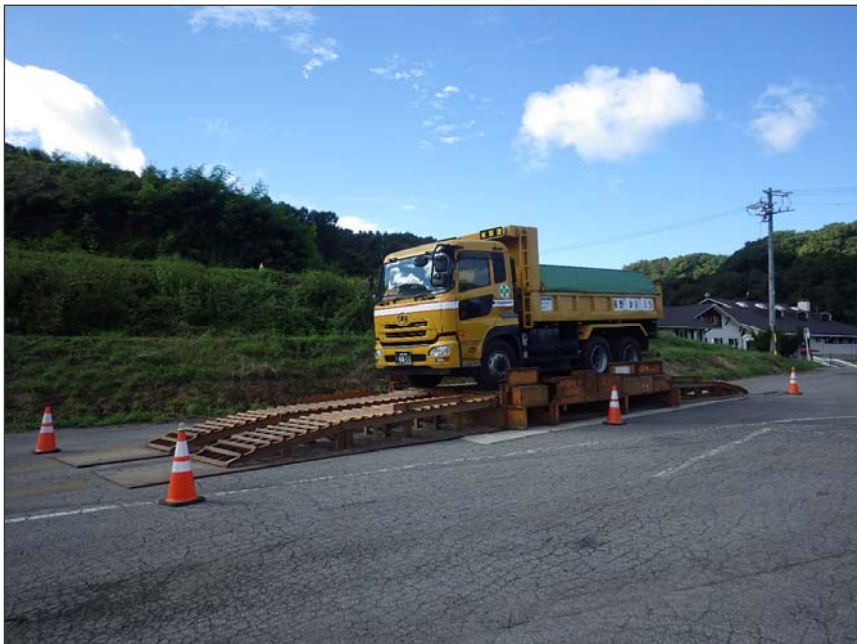
写真区分: 施工状況写真 工種: 仮設工 種別: 泥落装置設置工 細別: 設置 写真タイトル: 使用状況 撮影箇所: 現場にて