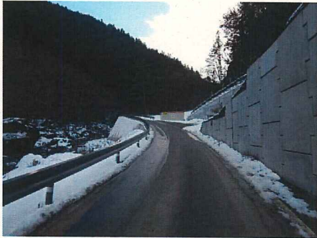
工事用道路の仮舗装