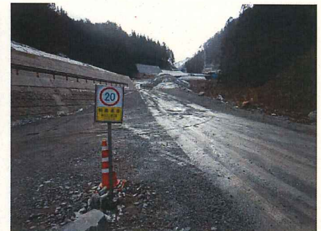
規制速度・走行速度の明示