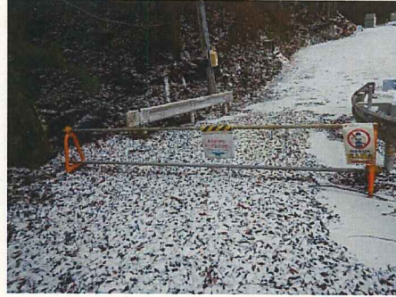
工事現場への立ち入り禁止柵