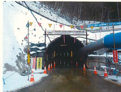
トンネル坑口 防音屏の設置