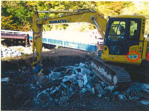
排ガス対策型・低騒音型建設機械