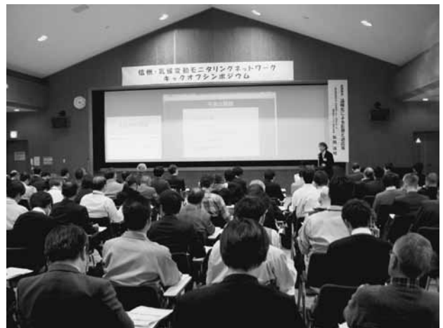
会場での講演風景

当研究所の飯綱庁舎大会議室で開催したシンポジウムには、スタッフを含め116名の皆様にご参加を頂きました。交通の便の悪い飯綱庁舎に、大会議室が満杯になるほどの方々にいらして頂いたこと、この場を借りて厚くお礼を申し上げます。