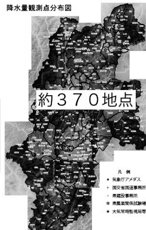
背景は長野県河川砂防情報ステーションの地図を利用