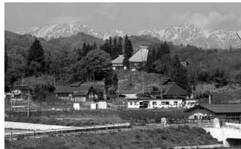
信州の代表的な里山の風景(中条村)

下記のホームページでもご覧いただけます。 http://www.pref.nagano.jp/xseikan/khozen/sizen/sato.htm