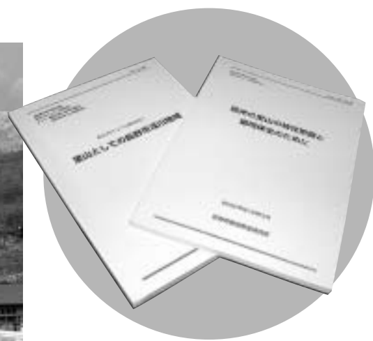
プロジェクトの成果報告書