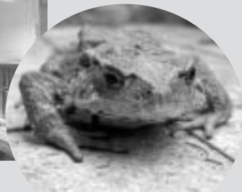
アズマヒキガエル 2004年5月14日に研究所の片隅で埃まみれで発見された