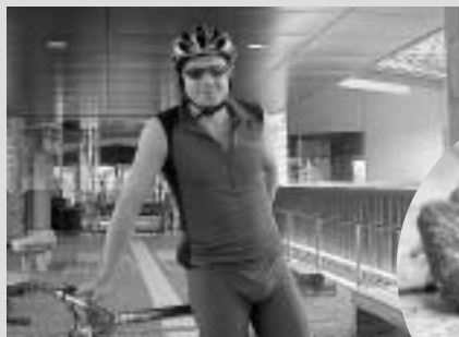
2006年8月5日、長野市に滞在中のMr Grant from Colorado State, USA.