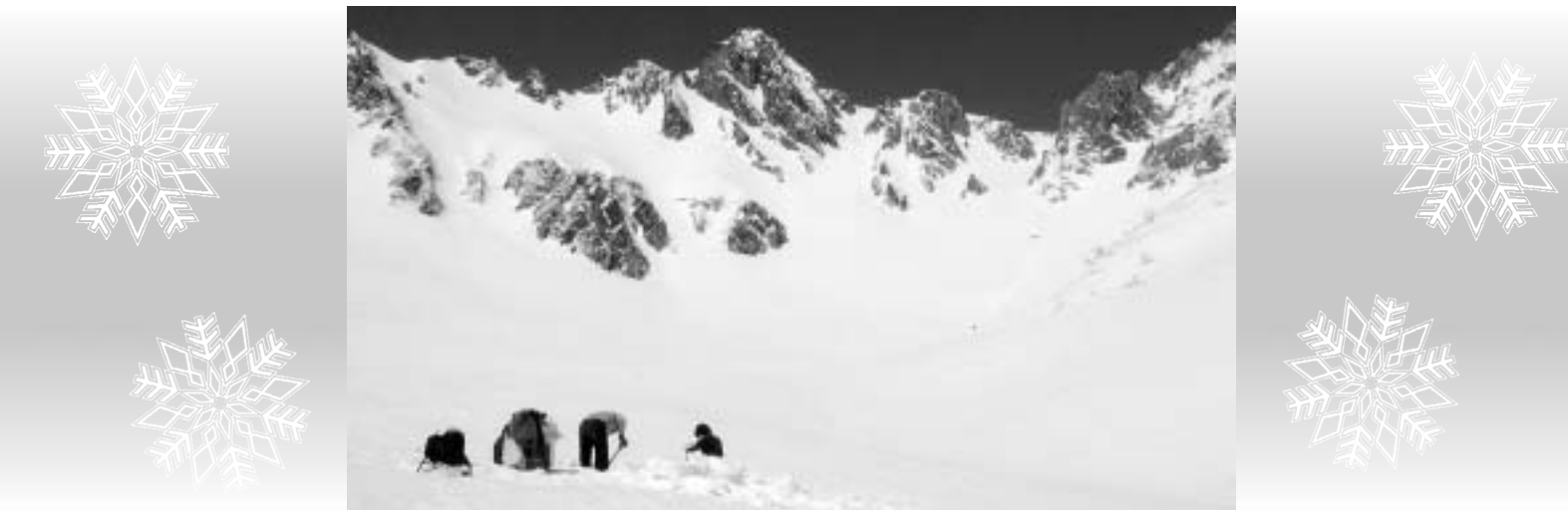
中央アルプス千畳敷における調査