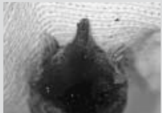
ヒメヒミズ:2003年2月に所内で発見された(その後、弱っていたために介護の甲斐なく翌日死亡)