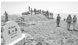
○王ヶ鼻 松本の街並みと北アルプスのパノラマが広がる標高2,008mの絶景スポット！