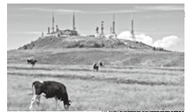
○牧場 400haの広大な牧場に、5月～10月の期間牛が放牧される。