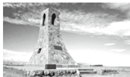
○美しい塔 高原のシンボル♪アルプスを背景に記念撮影ができる絶好のポイント。