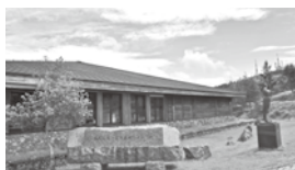
○美ヶ原自然保護センター 高原の自然・歴史・文化を分かりやすく展示しています。