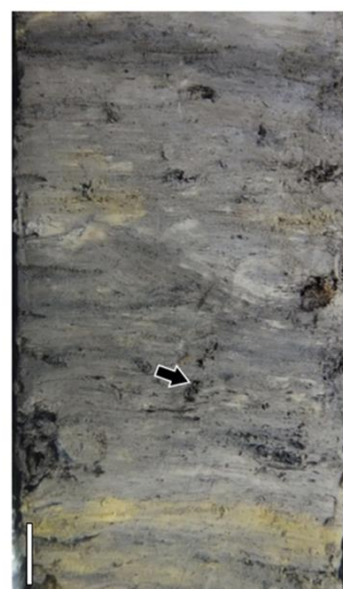
図2 諏訪湖堆積物コアの泥質堆積物に含まれる根化石（矢印の先）。スケールバーは1 cmを示す。

成果： 両コアにおいて、更新世の最終氷期末（約1万6000年前）～完新世中期（約6000年前）に相当する層準には、泥質堆積物が連続的に堆積しており、湖環境が広がっていたことが明らかになりました。この泥質堆積物の化学分析によると、数百~数千年間隔でSiO 2 量の低下が認められ（図3A）、珪質な殻をもつ珪藻が頻繁に減少していたことが示されました。珪藻の減少する層準には、古土壌の痕跡（根化石など）が認められ（図2、図3Aの赤矢印）、コアの掘削地点が地表に露出し、長期間空気に曝されていたことがわかりました。これらの結果から、諏訪湖の水位の一時的な低下により干上がったコアの掘削地点では古土壌が形成され、珪藻の堆積が停止したと考えられました。水位の低下は、両コアで共通して4回（約1万2000年前、約8000年前、約7900年前、約7000年前）認められました（図3の黄色の背景部分）。約1万2000年前と約7000~8000年前は、世界的に寒冷だった時期（ヤンガードリアス期 (注3) 、約8200年前の寒冷化イベント）に概ね一致します。これらの時代は、東アジアにおいては、夏季モンスーンが弱まった乾燥期であったとされます（図3Cの薄緑色の領域）。以上のことから、東アジアの乾燥化により、諏訪湖周辺では降水量（流入量）が減少し、湖の水位が低下したと考えられます。この結果は、世界的な百~千年スケールの気候変動に駆動された東アジアの気候変動が、中部日本の内陸湖の水位に影響を及ぼした可能性を示します。