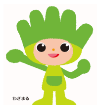
長野県ものづくり人材育成 応援キャラクター