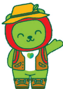
長野県 PR キャラクター「アルクマ」 (信州 DC バージョン) ©長野県アルクマ