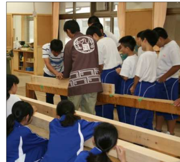
昨年度の状況(上田市立塩田中学校)