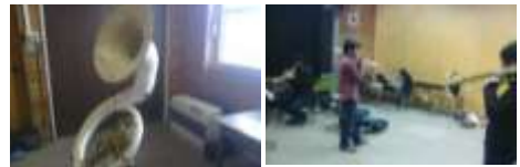
【整備楽器】 【初心者講習会】