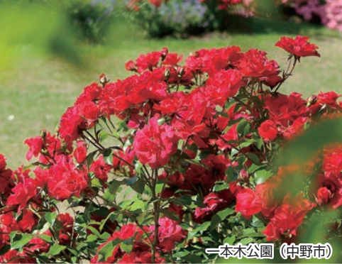
一本木公園 (中野市)