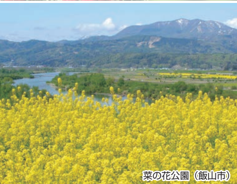
菜の花公園 (飯山市)