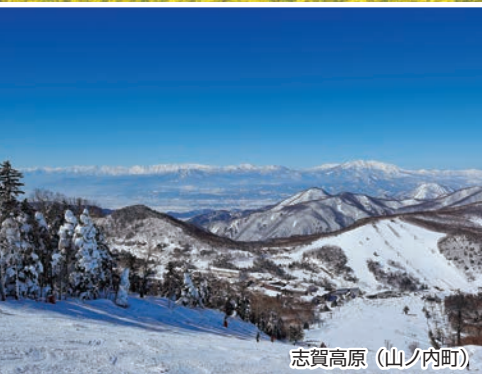
志賀高原 (山ノ内町)