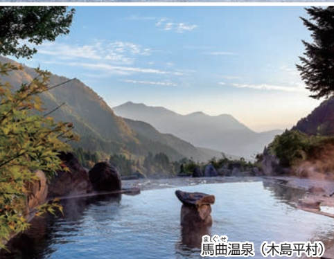
馬曲温泉 (木島平村)