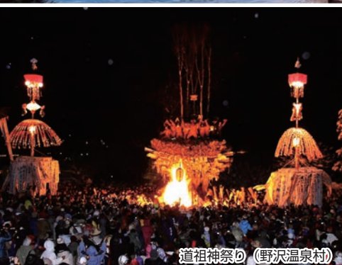
道祖神祭り (野沢温泉村)