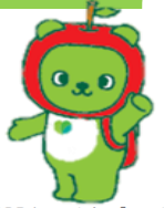
長野県PRキャラクター「アルクマ」 ©長野県アルクマ

今回は、市町村母子保健担当者会議の質疑応答、令和5年度乳幼児身体発育調査、令和3年度新生児聴覚検査の実施状況についてです。