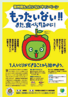
チラシ・ポスター (A4) (A2)