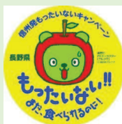
スウィングポップ 直径7センチ