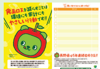
買い物チェックリスト (家庭用 (A5))