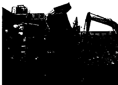
令和3年8月3日 中間処分場の確認状況

以下の観点も参考としていただいで構いません。（必要に応じ写真等を添付してください。）