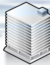
経済産業省 産業保安監督部長

http://www.meti.go.jp/policy/safety_security/industrial_safety/links/kantokubu.html