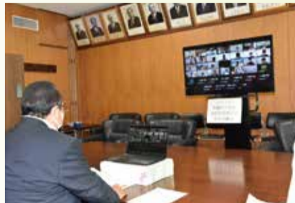
地域住民との意見交換(オンライン)