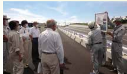
道路建設現場の調査