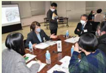
高校生との意見交換