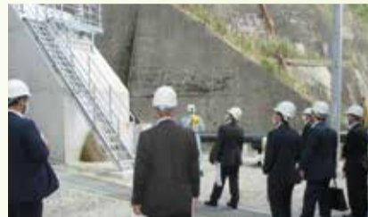
県企業局の発電所の調査