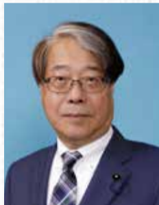
副議長 埋橋 茂人