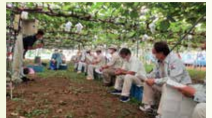
ぶどう施設栽培の視察