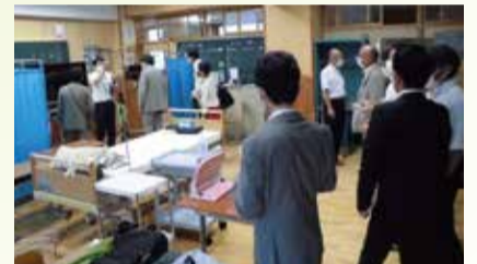
特色ある中学校の視察