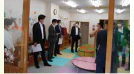
子ども支援施設の視察